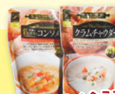
②パンによく合うスープ